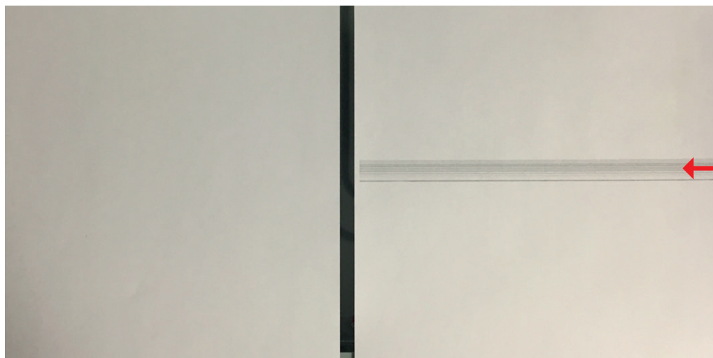
Beispiel: Original und Fehlerbild mit Streifen

Sollten Sie Streifen oder Unreinheiten in Ihrer Kopie entdecken, können Sie als erste Maßnahme alle Glasflächen mit einem trockenen oder leicht feuchtem Tuch reinigen.